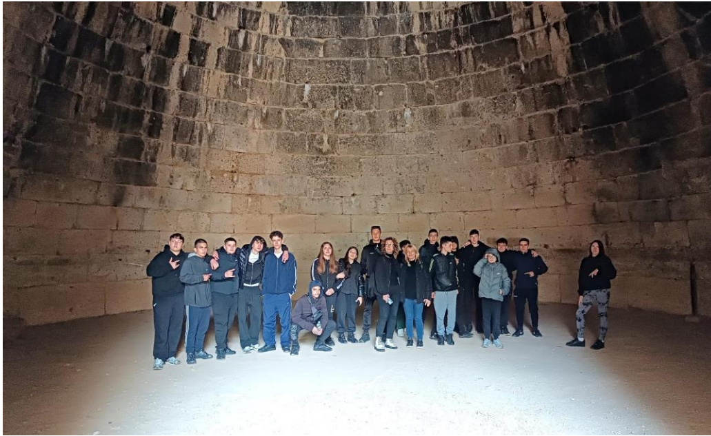
Μυκήνες – Θολωτοί τάφοι.