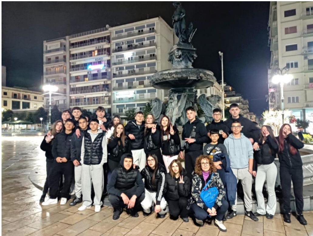
Βραδινή έξοδος στην Πάτρα