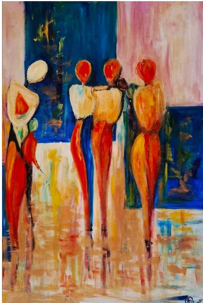
WOMEN BORN of COLOR SHAPED by STRENGTH

«Άκου, Μίλα, Δράσε: Μαθητικές Καλλιτεχνικές Δημιουργίες για την Έμφυλη Ισότητα»